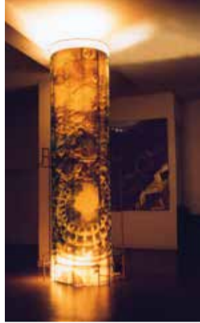
Mariakerk Haarlem Jules Kockelkoren De koepel van het Pantheon www.juleskockelkoren.nl