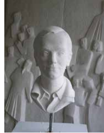
Fonteinkerk Haarlem Helga Troll Kunstwerk: Het Portret www.helgatroll.com