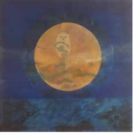
Engelmonduskerk Velsen Petra Meskers Uil schilderij www.artmeskers.nl