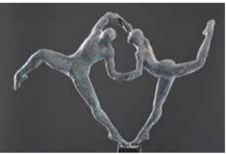
Naaldkerk Santpoort Noor Brandt Balans www.noorbrandt.nl