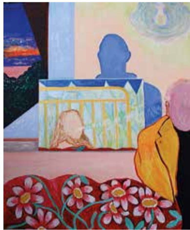
Adalbertus kerk Spaarndam Afke Spaargaren Kunstwerk: Die Liebende www.kunstmetstip.nl