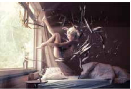
Dorpskerk Santpoort Stefan Witte Falling Asleep www.stefanwitte.com